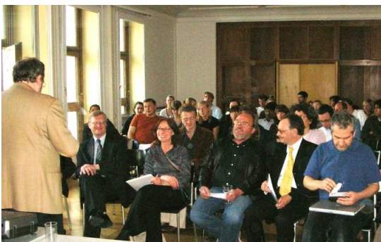
Erstes Studententreffen am 7. Juni im atelierfrankfurt