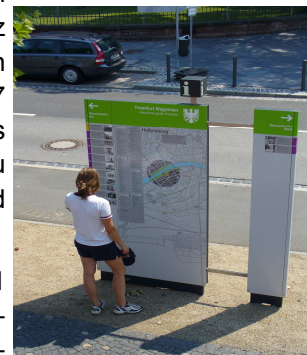
Einer der 17 Frankfurt Wegweiser am Holbeinsteg